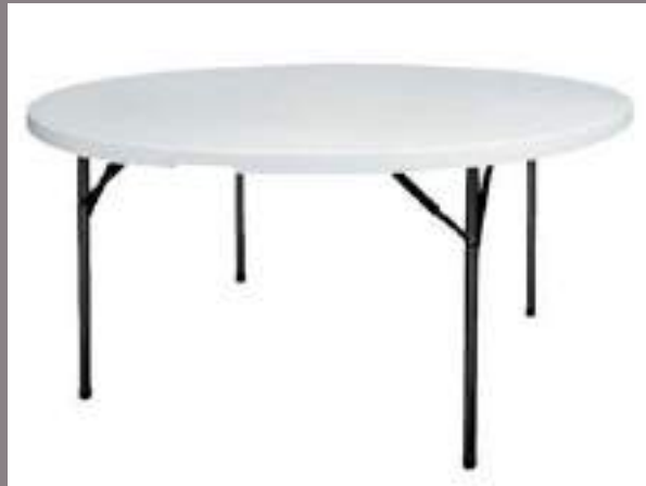
Table ronde blanche 180 cm