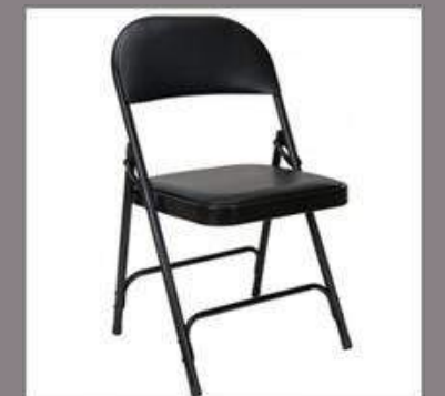
Chaises pliantes noires