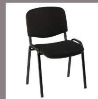
Chaises de conférence