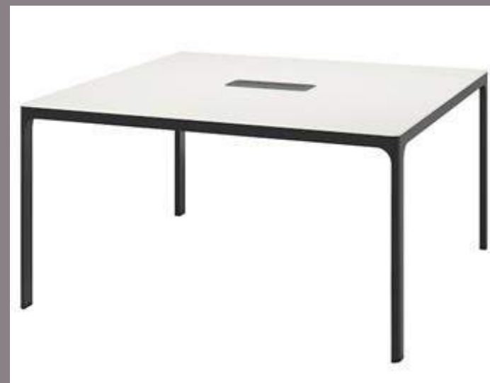
Table de conférence carrée blanche 140cm x 140cm