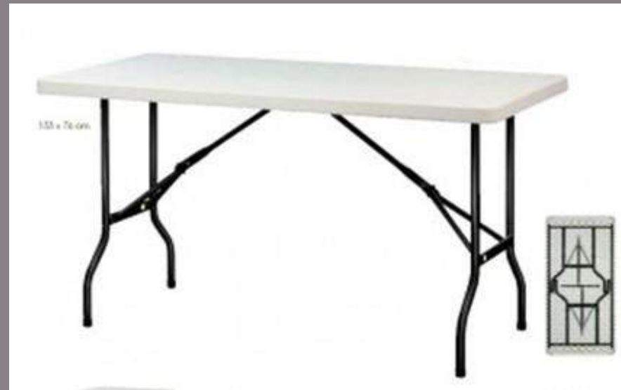
Table rectangulaire blanche 180 cm