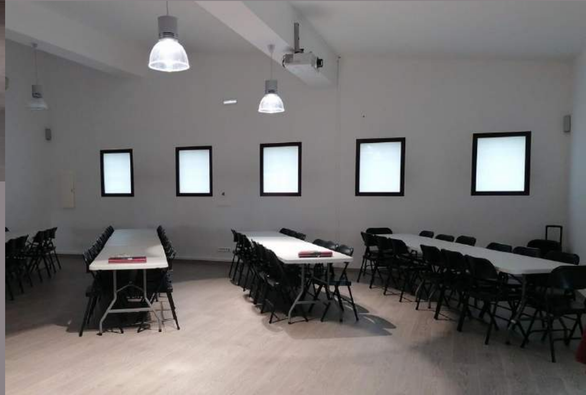
Salle Hippocampe - 110 m 2