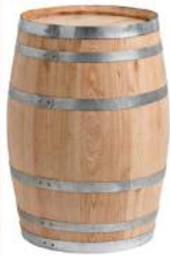
Barrique traditionnelle Quantité : 10