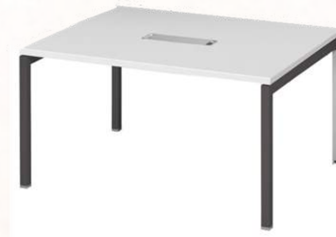
Table conférence carrée 140cm Quantité : 10