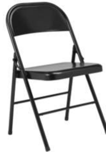
Chaise pliante noire Quantité : 100