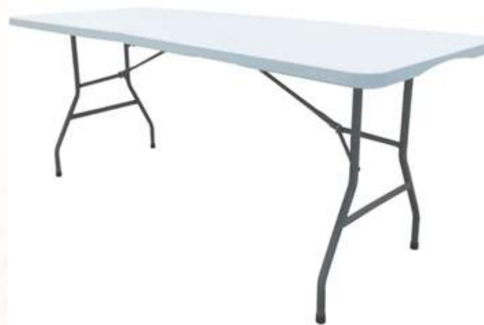
Table rectangulaire blanche 180x74cm Quantité : 15