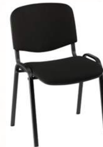
Chaise de conférence Quantité : 45