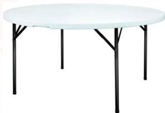
Table ronde blanche Ø180cm Quantité : 20